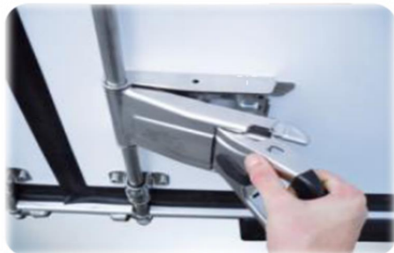
Нова ручка "Easy Handle" з одним рухом, на задніх дверях