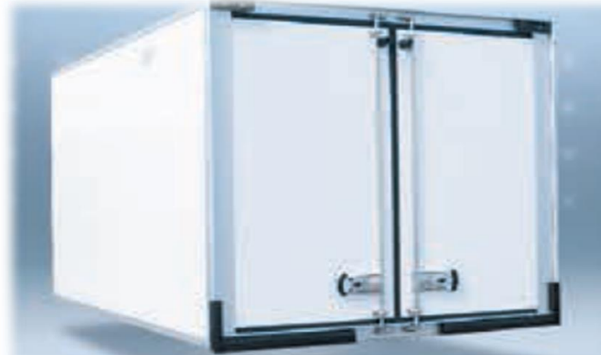
Композитні панелі (харчовий гелеобразний шар - поліефір - поліуретан), оснащені алюмінієвими вставкам