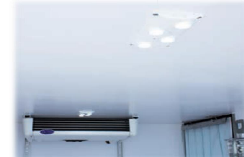
Світлодіодний світильник з перемикачем всередині кабіни

* Всі зображення автомобіля, кузова та салона наведені як приклад і можуть відрізнятися від фактичного